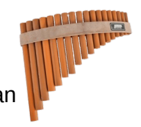
flûte de pan