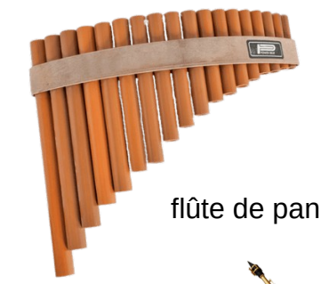
flûte de pan