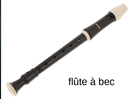
flûte à bec