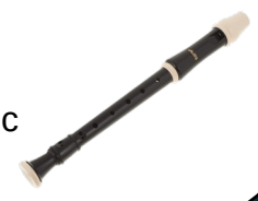
flûte à bec